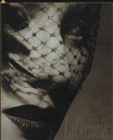
Вставка к проекту «Видневый сад»

них на лицах нарисованы черные маски. Такой декадентский альбом, красивые пейзажи, красивые образы. Мне всегда казалось, что все герои Чехова абсолютно несексуальны, у них нет пола, они больше философы, назвали мужчинами или женщи-