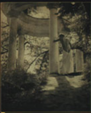
Из проекта «Видневый сад»

— У меня сейчас очень интересный новый проект — альбом «Видневый сад». Все «актеры» — женщины, они же играют роли мужчин, только у