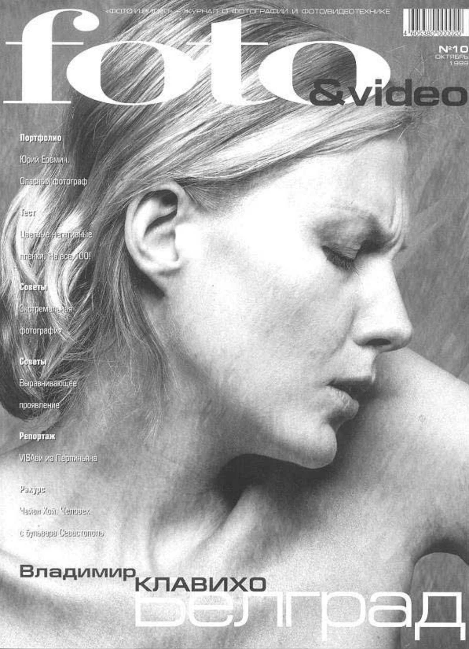
foto & video